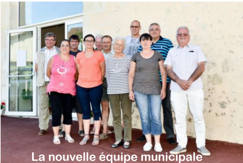
La nouvelle équipe municipale